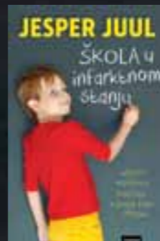
Knjigu Jespera Juula Škola u infarktnom stanju objavilo je Znanje

Suvremeno doba sve nas, pa tako i nastavnike i roditelje, stavlja pred nove izazove, načinom života i zahtjevima okoline. Ako želimo živjeti aktivan, ispunjen i kreativan život, a ne svesti svoju svakodnevicu na puko preživljavanje, moramo razviti neke dodatne vještine, odnosno izgraditi drugačiji odnos prema samima sebi. Potrebno je usuditi se biti hrabar, razvijati vlastite sposobnosti i potencijale, ali prije svega zalagati se za ono u što sami vjerujemo, a ne povoditi se za društvenim konvencijama ili onime što su nas naučili naši roditelji, ako to nije u skladu s našom osobnošću.